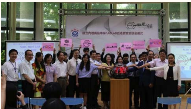
本校覓克思 MICS 自造實驗室啟動儀式