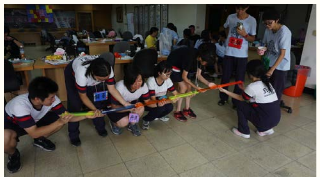
大手拉小手同儕輔導團初階培訓進行探索活動