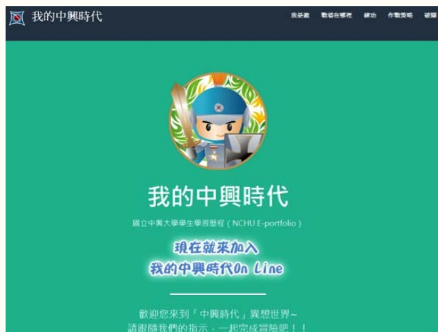
圖二、國立中興大學 E-portfolio 採用遊戲介面圖