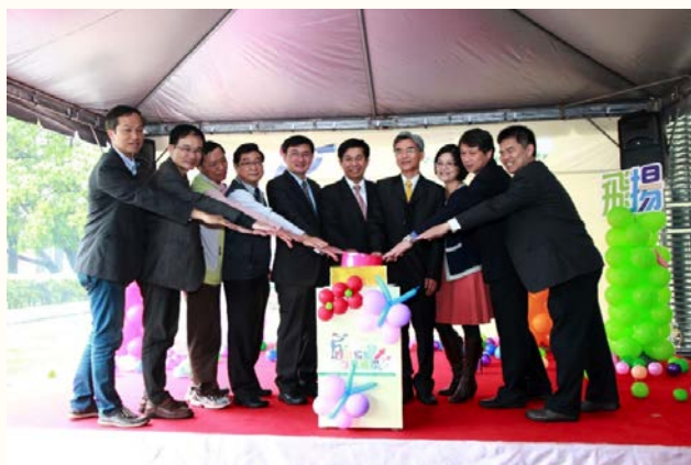
圖四、政府首長及立委蒞臨本校就業博覽會開幕式

本中心也將大部分活動申請登錄為本校「通識自主學習課程」，學生們在依個人需求主動參與活動的同時，亦能獲得通識學分，提升學生參與活動及課程的誘因及需求的強度。藉由自主學習系統，讓學生在參加活動後，可以明確呈現出累積獲得之各項核心能力。同時方便學生檢核及計劃性的培力過程，有效累積實力，幫助學生更有信心面對未來。