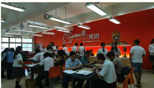
本校覓克思 MICS 創客空間