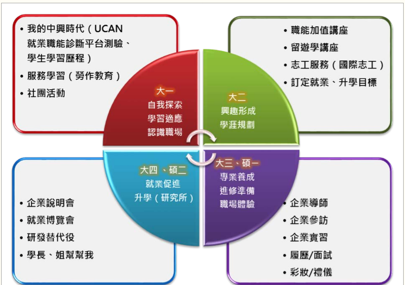
◎ 從職涯自我探索到職場能力養成的學習歷程