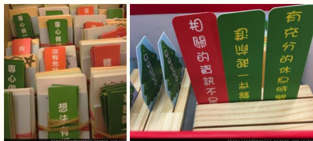
右方為正式版卡牌

想做但沒有行動力的根本原因，並運用 power 加值卡，依序詢問該生「繼續這樣下去你會變得如何？」「你做了什麼，讓情況沒有變得更糟？」等問句，協助學生聚焦在自己有哪些阻礙，並請該生聚焦在自己有哪些資源，並善用資源，以便訂定個人目前可執行的小計畫。