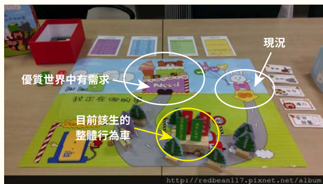
圖一、整體行為車、地圖、小方塊標誌出資源和阻礙的內容，並協助學生將局勢區分出內控和外控。

了解學生們在目前能夠支持和阻礙的力量有哪些，例如家人、朋友、學校等外在的人事物能否支持他試探或體驗想要的職業世界，以及該生內在想法、行為、感覺和生理狀態是該生的助力還是阻力。具體讓該生了解自己目前的現況為何，協助該生將現況分成自己可以改變的，和自己無法選擇兩部分。