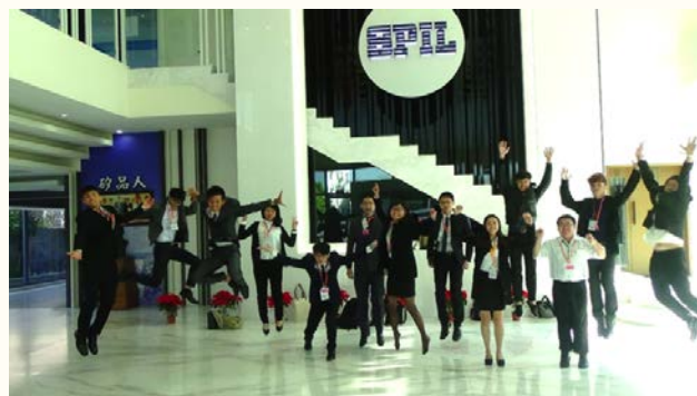
圖三、學生參與「興學塾」企業導師活動，展現熱情與活力