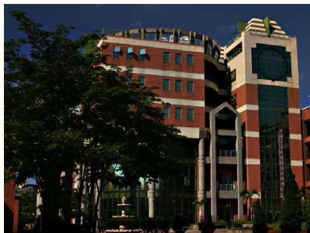
優美的校園景致—圖書館