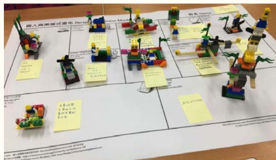
圖 2. 運用 LSP 的個人商業模式

筆者以個人商業模式畫布為工具，協助大學生運用 LSP 的引導方式，來發展未來的工作領域與模式。其步驟如下：1. 先請小組成員分別建構「我能幫助誰？」的個別模型，藉由討論的方式選出小組的一個目標顧客的個別模型。2. 建構「我如何幫助他？」的個別模型。3. 運用「創造圖像」的技術，分析其共通性與差異性，保留適切的個別模型。4. 運用「分享模型」來統整第二步驟的個別模型為一個整體模型。5. 重複二至四步驟來依序完成「我要做什麼？」、「誰能協助我？」、「我擁有什麼？」、「我要付出什麼？」、「我如何跟對方互動？」、「我如何宣傳？」、「我能獲得什麼？」等分享模型。6. 小組為此創業方案命名。7. 將模型放置個人商業模型的海報上 (如圖 2)。8. 進行小組間的觀摩，並票選最佳的創業方案。