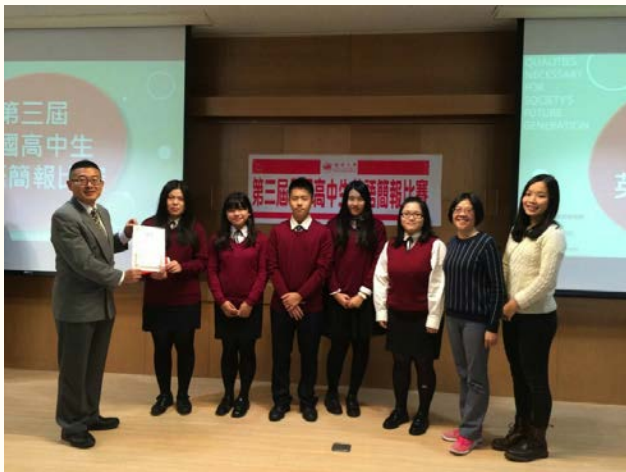
本校學生榮獲第三屆全國高中英文簡報比賽第一名